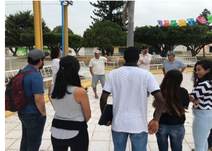
Diagnostico comunitario, estudiantes del doctorado en psicología UNICACH.