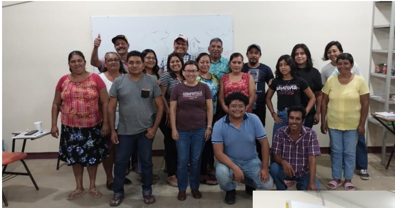
Acompañamiento psicológico con padres de familia de la Secundaria local mediante talleres. Estudiantes de la maestría en psicología, UNICACH.