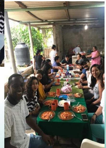
Entrevistas de recuperación de la memoria histórica de la comunidad. Estudiantes de licenciatura y maestría en psicología, UNICACH