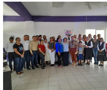
Participación en la Red Juntos para Ayudar de la Fundación del Dr. Simi