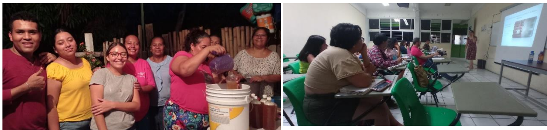
Intercambio de experiencias con jóvenes estudiantes universitarios

Intervención en el Colectivo de Productoras de la Tienda Solidaria Kolping.